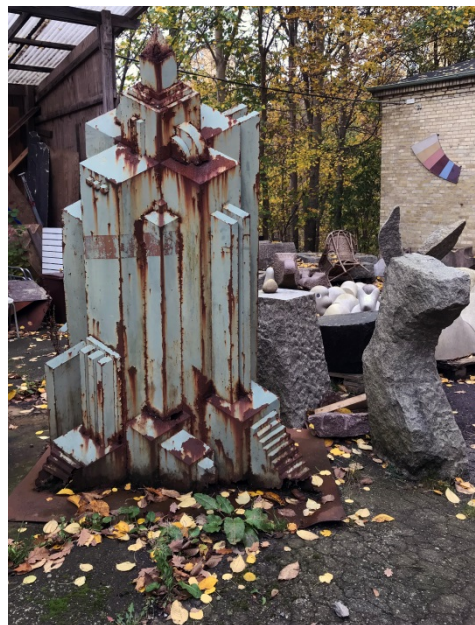
En härlig upplevelse på Konstepidemin är att vandra runt i parken för att ta en titt på alla utplacerade verk.