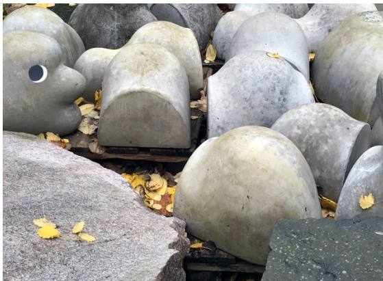
Ett annat utplacerat verk i Konstepidemins park.

Det går inte att söka för hela kostnader utan man måste också ha en annan finansiering. Denna finansiering behöver dock inte vara som pengar. Det kan vara arbetstid och lokalkostnader som räknas om till pengar. Det finns ofta också krav på att man ska ha kommuner som medfinansierare. Då kan man samarbeta med en institution. Då kan kommunernas arbetsinsats vara en medfinansiering. Ibland kan det stå ren finansiering. Då fungerar det inte att byta pengar mot arbetsinsatser.