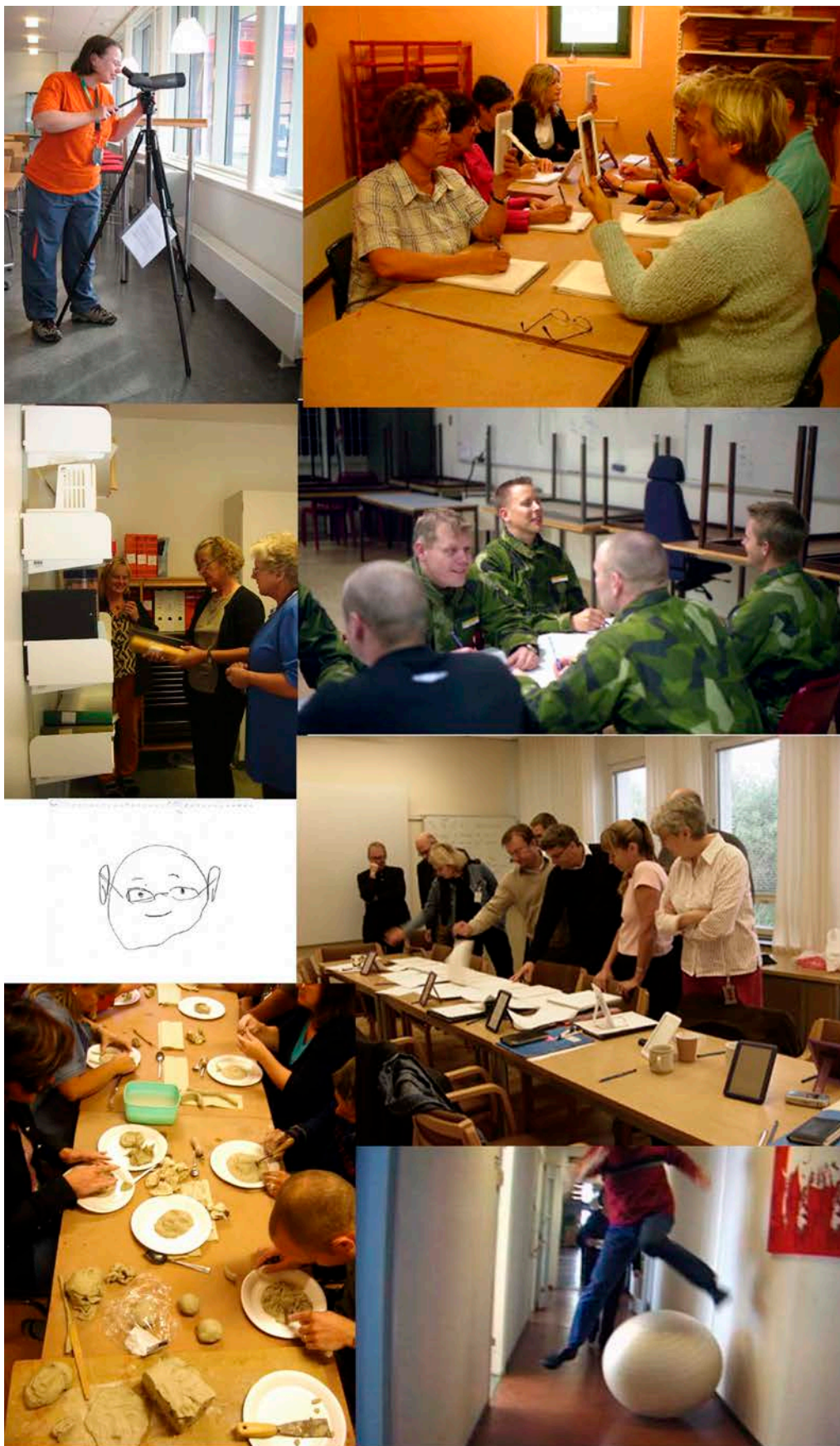
Workshops i Upplands Bro kommun 2005 - 2006 på skolor, kommunhus samt på Livgardet.